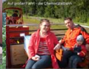
Auf großer Fahrt - die Chemnitzbahn